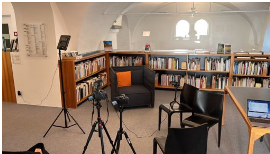
Installation pour un entretien filmé dans la bibliothèque de documentation de St. Moritz, le 15 janvier 2022

Plusieurs publications sont déjà parues et vont continuer de paraître à ce sujet. Du reste, différents articles du premier numéro de la revue Les Sports Modernes mettent en avant le patrimoine exceptionnel de l'Engadine.