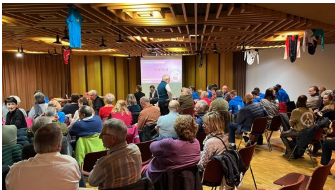
Conférence à Savigny, le 17 février 2022

Notre ambition est de dupliquer un tel projet pour d'autres événements à l'avenir.